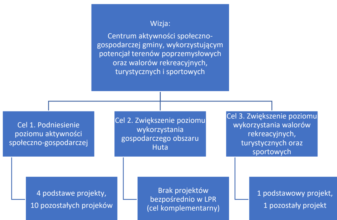
Rysunek 5. Struktura Lokalnego Programu Rewitalizacji dla Gminy Ozimek

W programie rewitalizacji założono, że obszar rewitalizacji stanie się centrum aktywności społeczno-gospodarczej gminy, wykorzystującym potencjał terenów przemysłowych oraz walorów rekreacyjnych, turystycznych i sportowych.