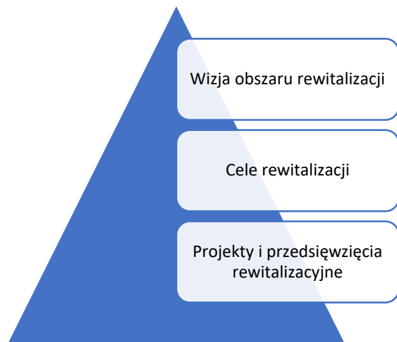
Rysunek 4. Model rewitalizacji zastosowany w Lokalnym Programie Rewitalizacji dla Gminy Ozimek

Mając na uwadze definicję rewitalizacji, która zakłada, że jest to proces wyprowadzania ze stanu kryzysowego obszarów zdegradowanych, prowadzony w sposób kompleksowy, poprzez zintegrowane działania na rzecz lokalnej społeczności, przestrzeni i gospodarki, skoncentrowane terytorialnie, prowadzone przez interesariuszy rewitalizacji na podstawie gminnego programu rewitalizacji – w gminie Ozimek nakreślono plan realizacji działań rewitalizacyjnych. Plan ten oparto na wizji, celach oraz projektach i przedsięwzięciach rewitalizacyjnych.