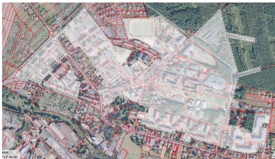
Rysunek 2. Obszar rewitalizacji w gminie Ozimek – Podobszar A