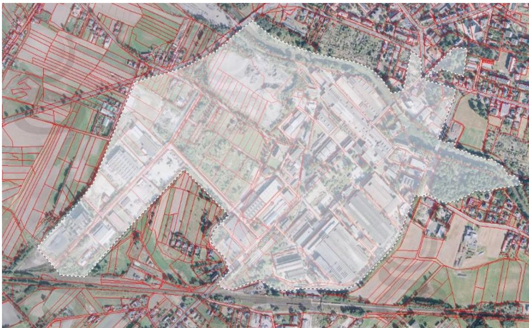
Rysunek 3. Obszar rewitalizacji w gminie Ozimek – Podobszar B