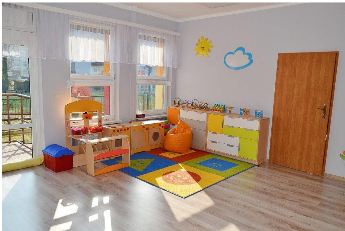
Zdjęcie 5. Wnętrze obiektu żłobka w Ozimku